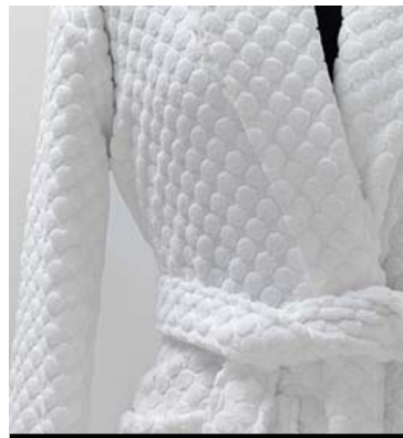
TEXTILES PARA CONTRACT / CONTRACT FABRICS