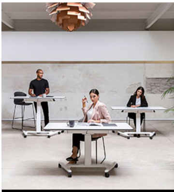
EQUIPAMIENTO DE OFICINA / OFFICE EQUIPMENT