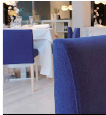
TEXTILES PARA CONTRACT / CONTRACT FABRICS