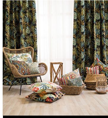
TEXTILES PARA CONTRACT / CONTRACT FABRICS