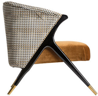
SILLONES Y BUTACAS / ARMCHAIRS