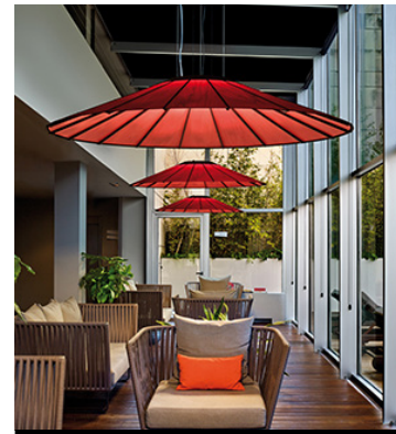
ILUMINACIÓN / LIGHTING