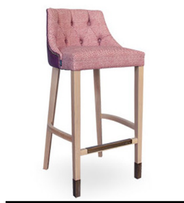
SILLAS Y TABURETES / CHAIRS AND STOOLS