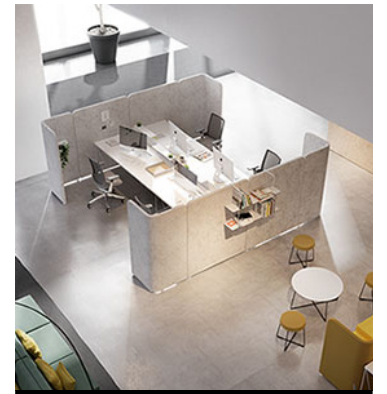
EQUIPAMIENTO DE OFICINA / OFFICE EQUIPMENT