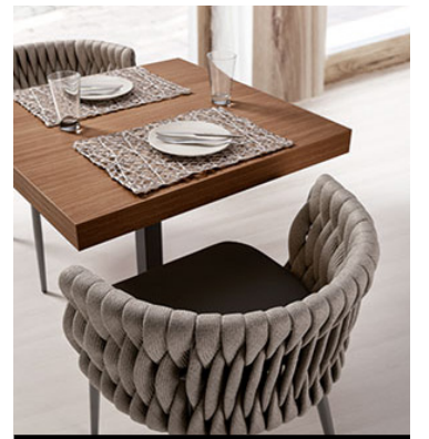
SILLONES Y BUTACAS / ARMCHAIRS