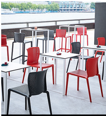
EQUIPAMIENTO EXTERIOR / OUTDOOR EQUIPMENT