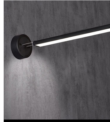
ILUMINACIÓN / LIGHTING